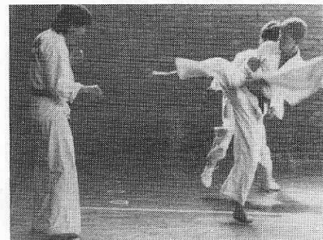
Jugend: Einzeltechniken und Kombinationen auf Maß geschneidert

Wie im sportlichen Wettkampf die Leistung begeistert, so zählen auch in einer geschäftlichen Partnerschaft der persönliche Einsatz und die bessere Leistung. 1,5 Millionen Kunden schätzen die Bayerische