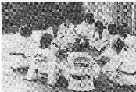
Plötzlich leise Töne: Geheimtaktik bei den Damen?