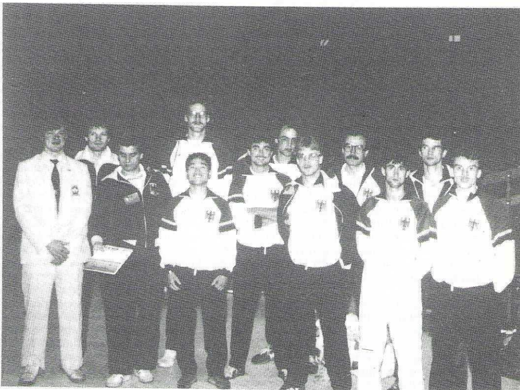
Die deutsche Herren-Nationalmannschaft ist bestens für die WM '87 vorbereitet

In der Mannschaftswertung belegte Korea den ersten, USA den zweiten und überraschend als beste europäische Nation Dänemark den dritten Platz. Unser Team kann mit dem vierten Platz zusammen mit Ägypten und Jordanien zufrieden sein.