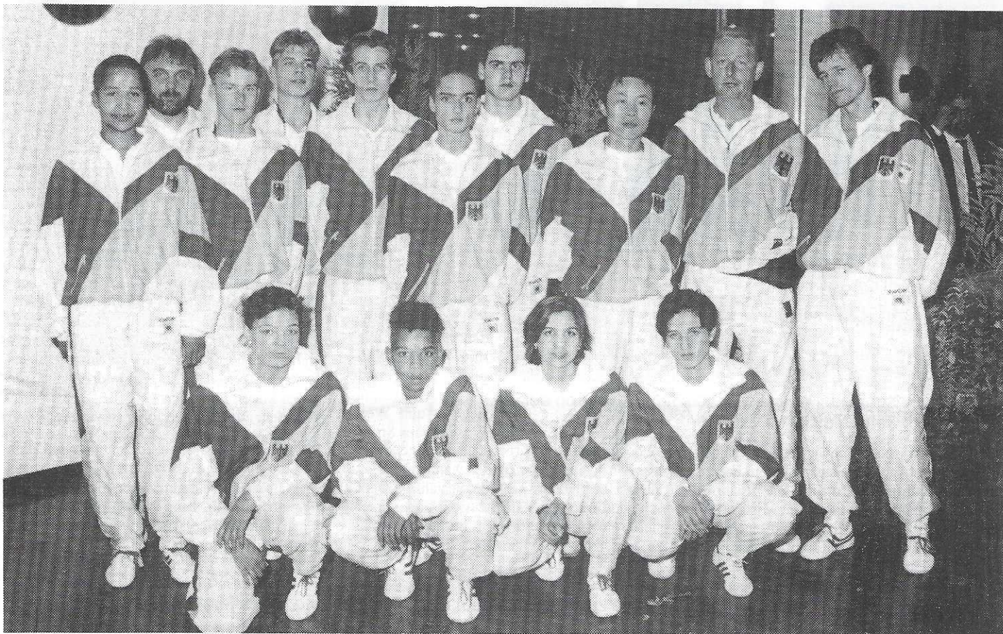
Früchte harter Arbeit: Die DTU-Jugend-Nationalmannschaft international wieder erfolgreich.

Deutschland zeigte sich nach der schweren Schlappe von 1990 erholt und erkämpfte sich wieder einen respektablen 5. Rang