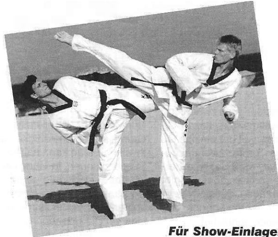
Für Show-Einlagen ist der Nürnberger immer zu haben.