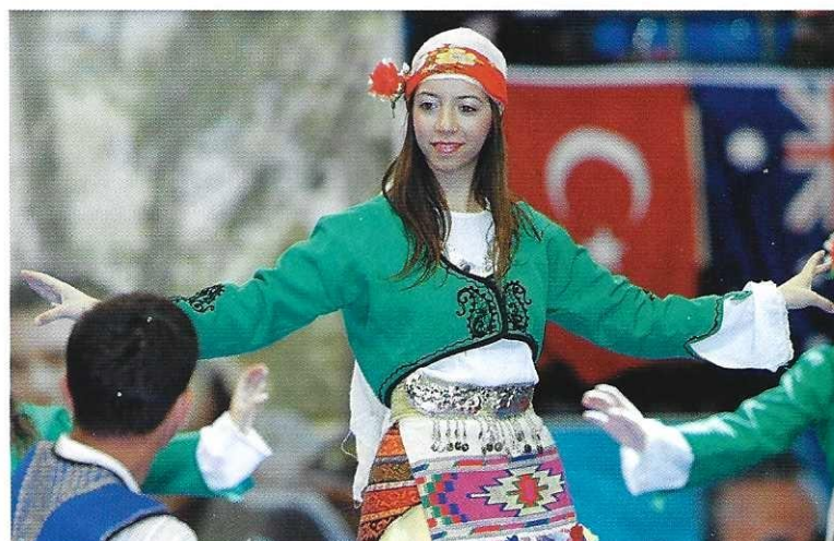
Türkische Folklore im Rahmenprogramm