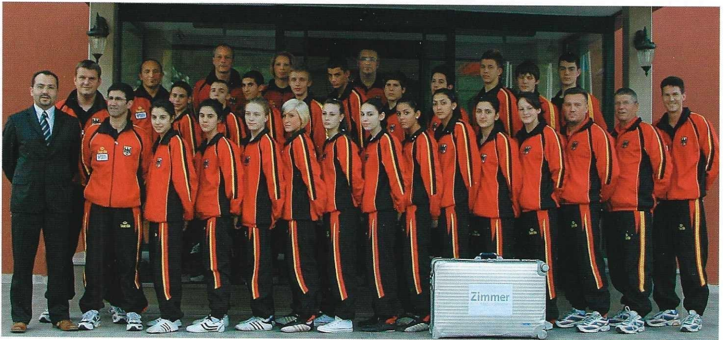
Die deutsche Junioren-Nationalmannschaft

Tage früher nach Izmir an, um sich für die Wettkämpfe vorzubereiten. Für weitere Maßnahmen war es leider nicht möglich, eine Befreiung der Jugendlichen von der Schule zu erreichen.