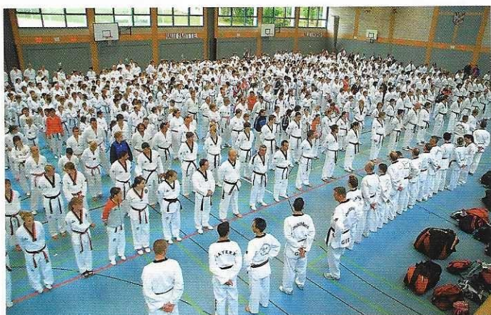
Die Referenten vor den Sportlern bei der Begrüßung