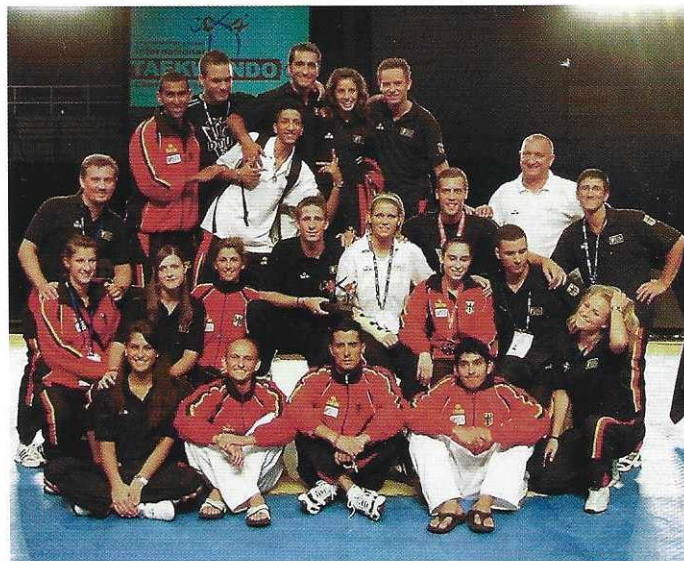
Das deutsche Team