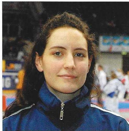
Vertreterinnen der ausrichtenden Vereine: