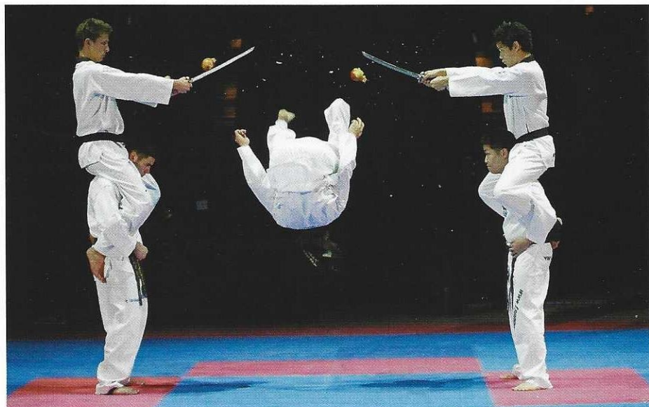
Trefflich: die Eröffnungsfeier (PB)