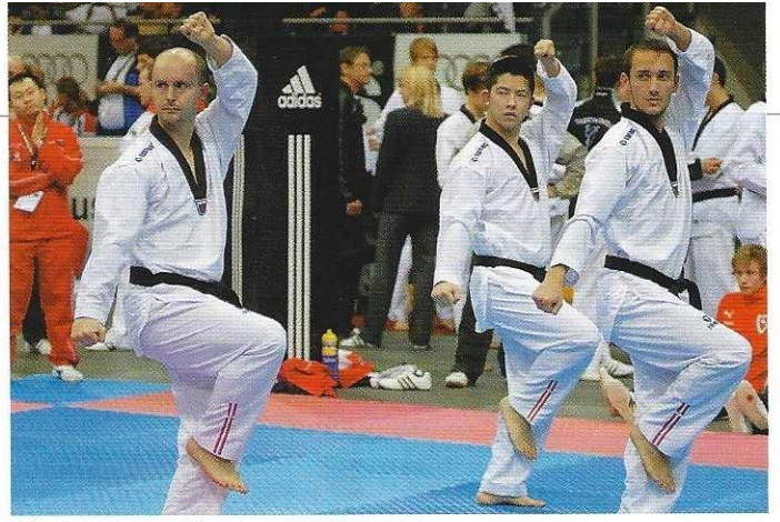
Das Synchronteam Herren 1 aus Dänemark