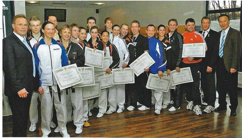
Verdiente Sportler wurden mit Ehrungen bedacht