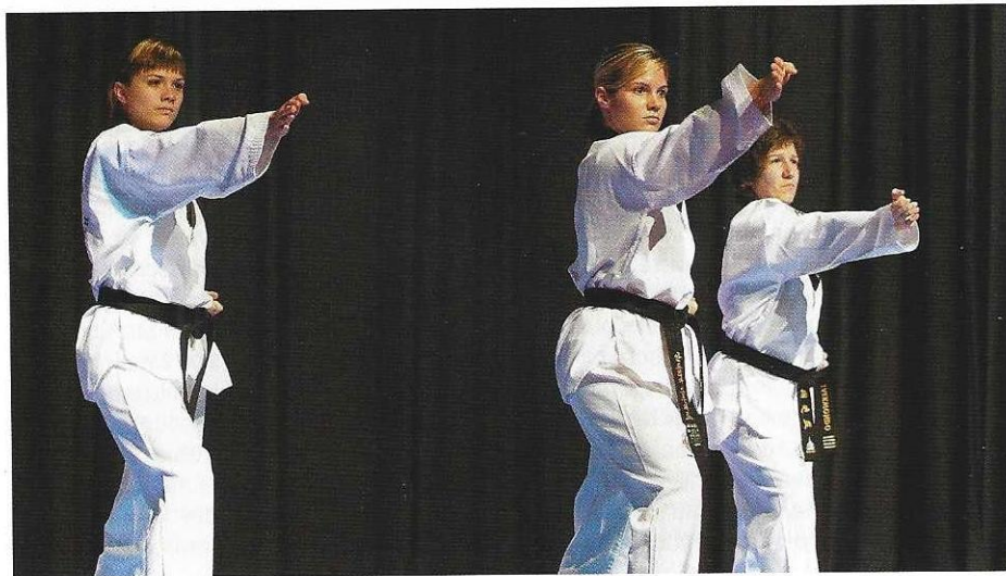
Damen-Formenteam aus Krumbach